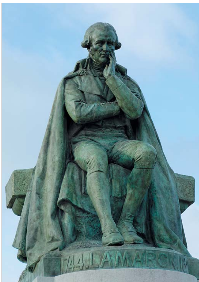
Statue af den franske naturforsker Jean-Baptiste Lamarck.

Lamarck, en ung pengeløs adelig fra Nordfrankrig, der som en anden D'Artagnan skaffede sig en hest og en kårde og drog til Paris for at tjene kongen, startede med en glørværdig men kortvarig militærkarriere i Syv-